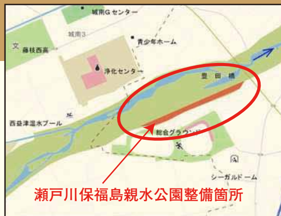
瀬戸川保福島親水公園整備箇所